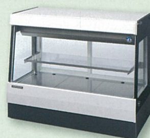
冷凍冷蔵用ショーケース など